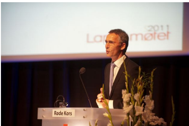
Statsminister Jens Stoltenberg talte til landsmøtet.